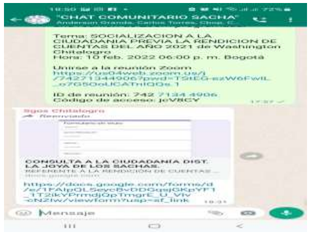
DIFUSIÓN DEL ENLACE EN LOS CHATS COMUNITARIOS