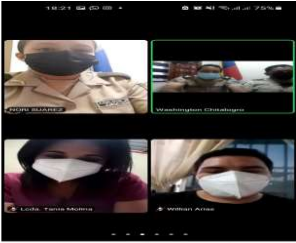
REUNIÓN DEL DISTRITO JOYA DE LOS SACHAS.