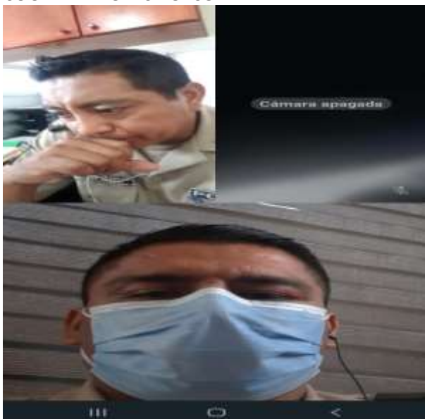
REUNIÓN DE LA SUBZONA ORELLANA A LOS COORDINADORES POLCO.