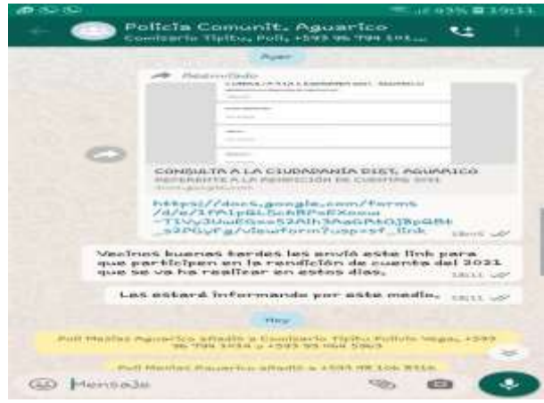
DIFUSIÓN DEL ENLACE EN LOS CHATS COMUNITARIOS AGUARICO